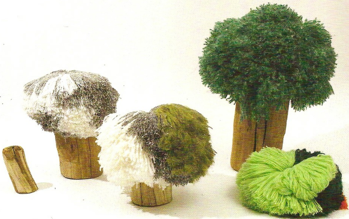
«Perpetual Green», 2007.