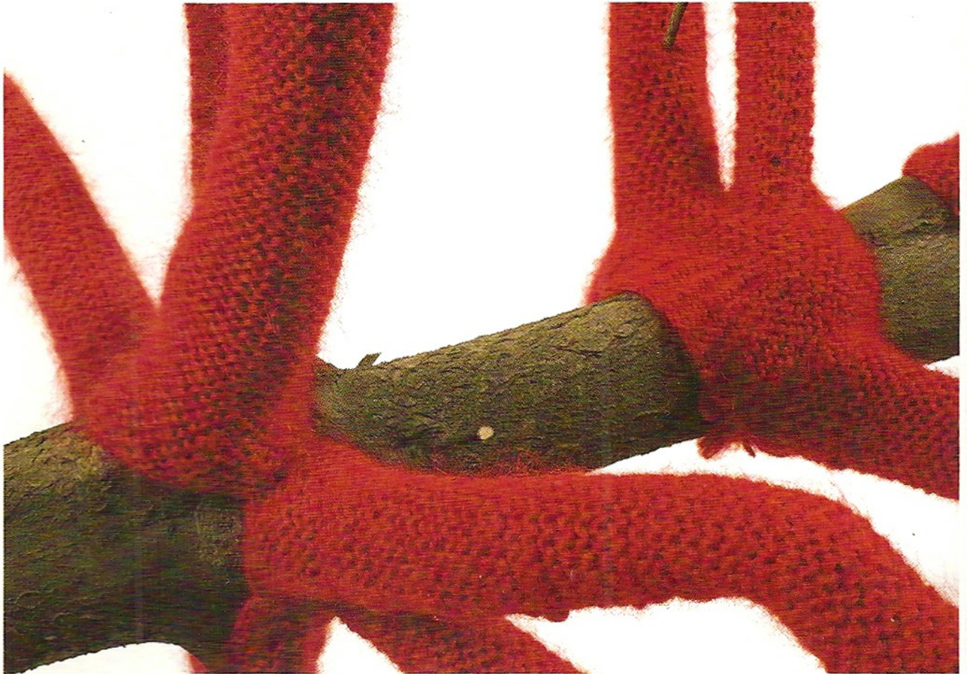
Page précédente : « A Red Dress for a Tree », 2007. Ci-dessus, détail.

amorphes sans corps. Elles sont ensuite habitées par des volumes façonnés en bois. Toutes ces sculptures sont réalisées uniquement à partir de ces deux matériaux, la laine et le bois. Parfois, la laine vient recouvrir une structure préexistante, celle d'un arbre déraciné, par exemple dans « A Red Dress for a Tree ». Ici le tricot devient enveloppe, appareil, ou parure. J'ajuste le tricot sur l'arbre telle une robe sur un corps. Paradoxalement, le fait de recouvrir ainsi une forme la révèle, lui donne de l'importance, et en même temps lui donne une nouvelle identité possible.