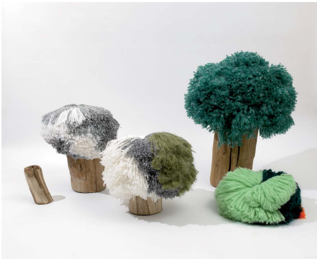
Ludvine Caillard / «Perpetual Green», 2008 / Essence de bois et laine