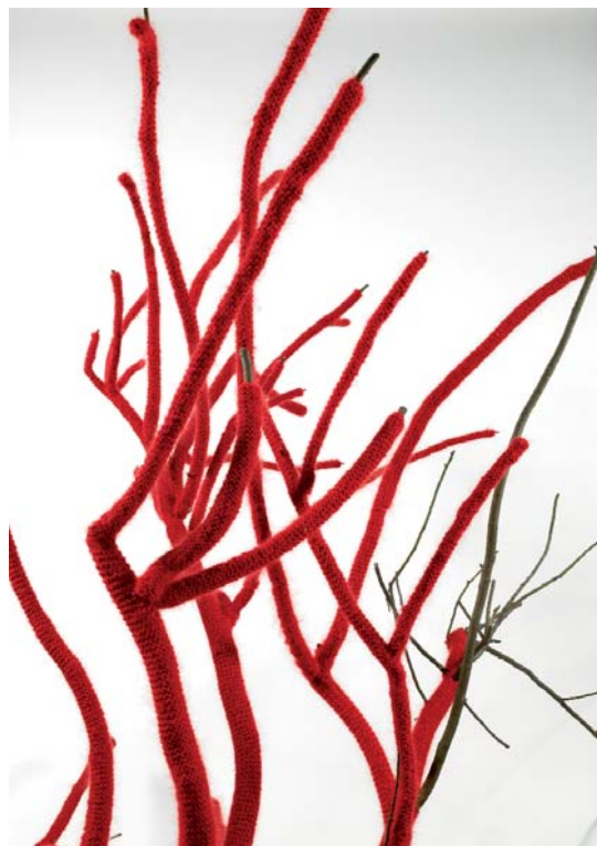
Ludvine Caillard / «A Red Dress For A Tree», 2008 / Bols, laine